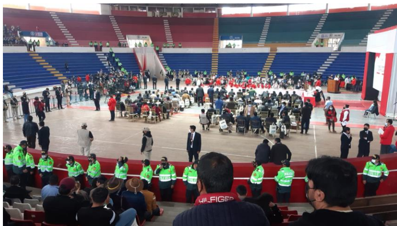
Grosser «Runder Tisch» in einer Arena in Cuzco – streng bewacht!