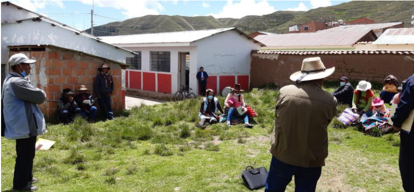
Kursarbeit unter freiem Himmel in der Region Cuzco.

Das Handwerk der Verhandlungsführung ist eines der Themen, das Leitungspersonen Möglichkeiten eröffnet, um Führung zu übernehmen.